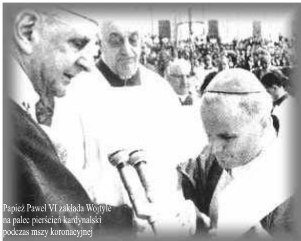
Papież Paweł VI nakłada Wojtyłę na palec pierścien kardynalski podczas mszy koronacyjnej

28 czerwca kardynał Wojtyła i inni nowo mianowani kardynałowie zbierają się w kaplicy Sykstyńskiej wypełnionej po brzegi publicznością. Wspólnie składają ślubowanie, po czym kolejno podchodzą do Ojca świętego, a Paweł VI nakłada im na głowę "Beretta rossa", czyli czerwony biret, wymawiając tradycyjną formułę: "Na chwałę Boga wszechmogącego i na chwałę Kościoła przyjmij tę oznakę godności kardynalskiej, dla której musisz się stać obrońcą wiary aż do przelania krwi". Równocześnie Papież przydziela każdemu kościół rzymski - w nawiązaniu do starożytnej tradycji, według której kardynałowie stanowili grupę proboszczów rzymskich pomagających papieżom w rządach Kościołem. Kardynał Wojtyła otrzymuje kościół San Cesareo in Palatio - stary, piękny kościółek na Palatynie, obok Term Caracalli, przy początku via Appia Antica. Gdy kardynał Wojtyła podchodzi do Papieża, po raz pierwszy w Sykstyńce rozlegają się brawa.