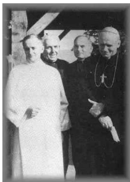
Taize, z bratem Rogerem, 1968

Do Taize przybywa się jak do źródła. Wędrowiec zatrzymuje się, zaspokaja pragnienie i rusza w dalszą drogę. (...) Moim pragnieniem jest, by Pan zachował was jako wiosnę, która wybucha i by zachował was małymi w ewangelicznej radości i przejrzystości miłości braterskiej. (Jan Paweł II)