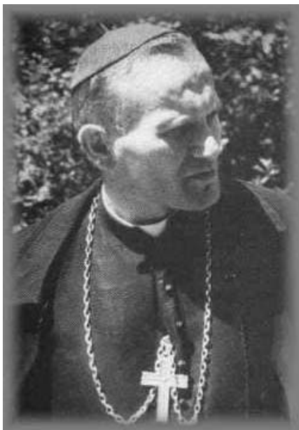
Kardynał Karol Wojtyła

Wracam pamięcią do okresu mojego pasterzowania w Krakowie. Kraków, a zwłaszcza jego dzielnica Kazimierz, pełna jest śladów żydowskiej tradycji i kultury. Na Kazimierzu było przed wojną kilkadziesiąt synagog, a niektóre z nich były wielkimi zabytkami kultury. Jako Arcybiskup Krakowski miałem żywe kontakty ze społecznością żydowską Krakowa. Bardzo serdeczne stosunki łączyły mnie z przewodniczącym gminy żydowskiej, co przetrwało jeszcze po moim przeniesieniu do Rzymu.