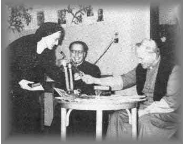
Kolędowanie w KIKu. Klasztor sióstr urszulanek w Krakowie, 1970

W dniu 6.XI.1970 roku odprawił modły w 25 rocz. śmierci Wincentego Witosa, przywódcy ludowców i byłego premiera rządu RP.